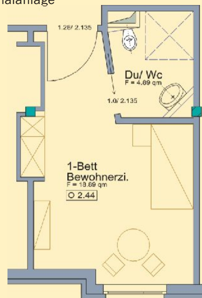
Abb.: Beispiel eines Einbettzimmers